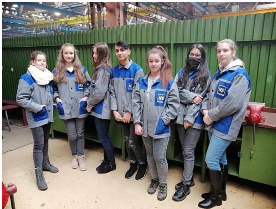
Žiaci 9. ročníka mali možnosť pozrieť si a aj vyskúšať, ako to funguje na Strednej spojenej škole v Detve

S príchodom nového roka sa našim deviatakom o niečo priblížila aj vidina odchodu. S tým je spojený výber ich ďalšieho štúdia. Viac—menej majú svoju ďalšiu cestu zvolenú, napriek tomu v týchto dňoch absolvujú celý rad návštev na stredných školách, ktoré sú v pôsobnosti nášho mesta, či najbližšieho okolia