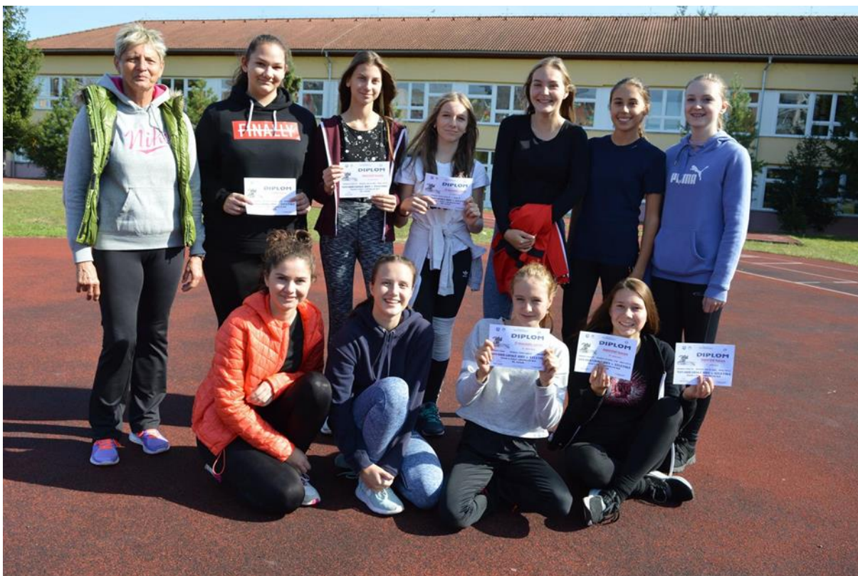
Úspěšný tým našich atlétok a atlétov