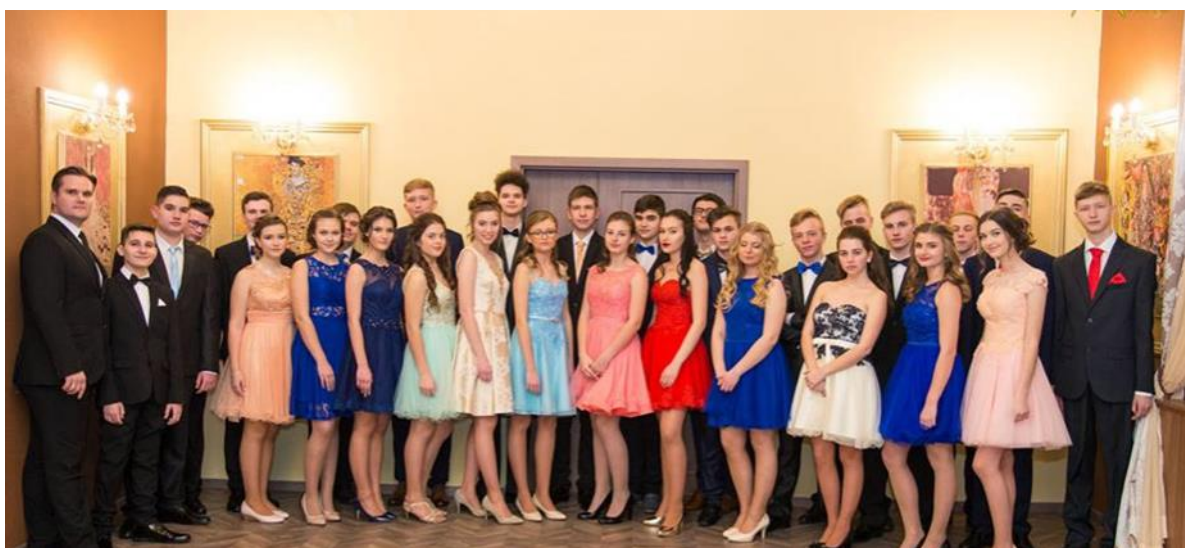
Text a foto S.P.