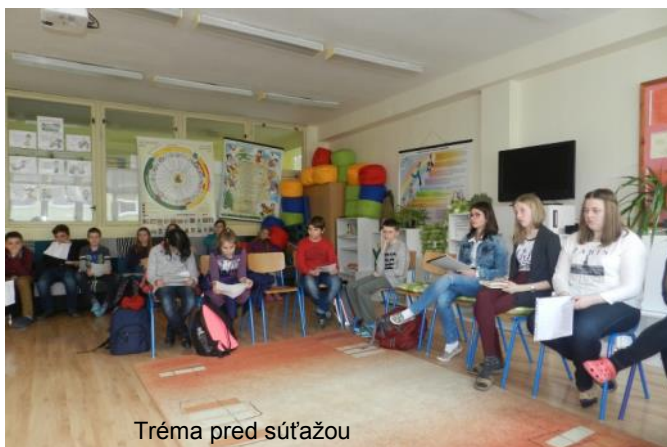
Tréna pred súťažou

Aj týmto našim reprezentantom gratulujeme a držíme silno prsty na regionálnom kole, ktoré bude v apríli.