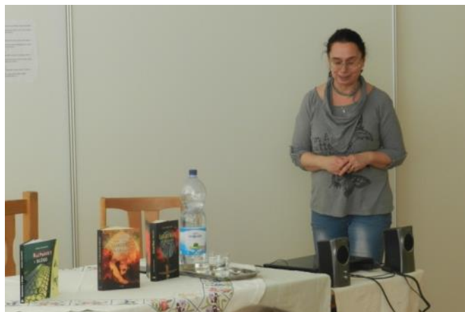
Text a foto S.P.