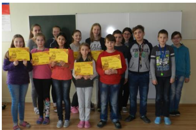
Víťazi školského kola na snímke so všetkými recitátormi