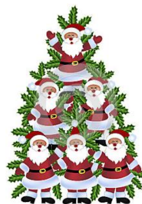
Tretiaci vyrábali ozdoby i vianočné maškrty, ktoré hneď aj ochutnávali