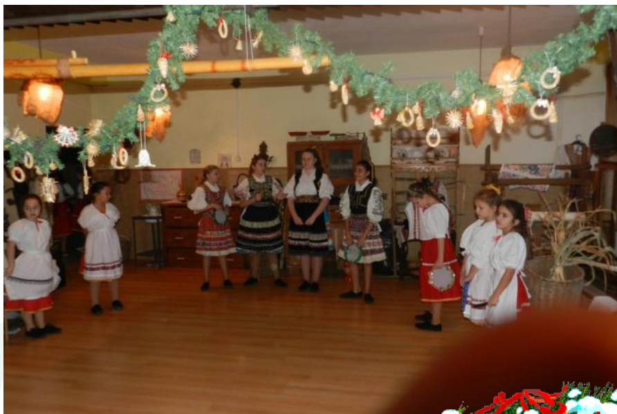
Otvorenie—speváci a tanečníci zo Zvončeka