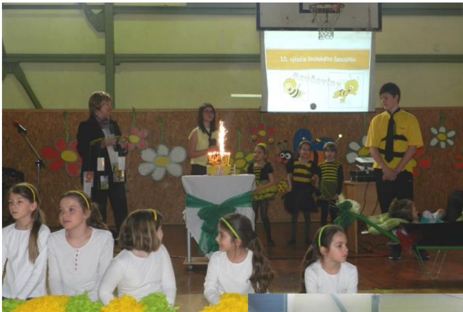
Na žiadnej narodeninovej oslave nemôže chýbať torta