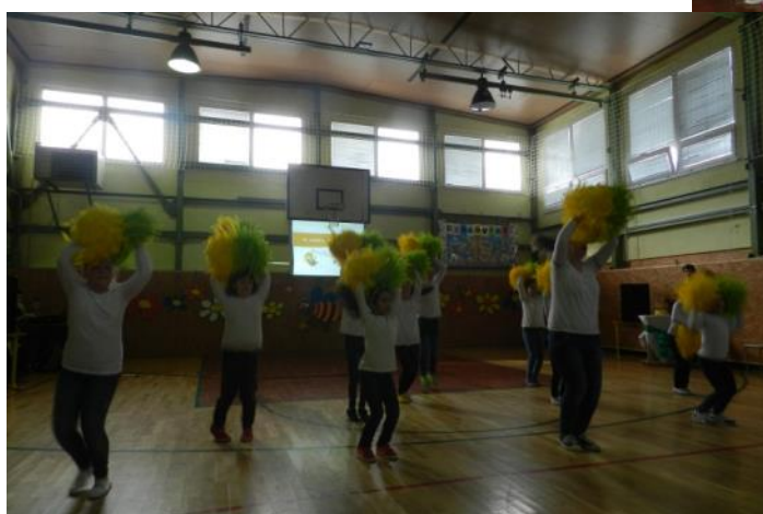
Dievčatá zo skupiny Smile pri úvodnej tanečnej choreografii