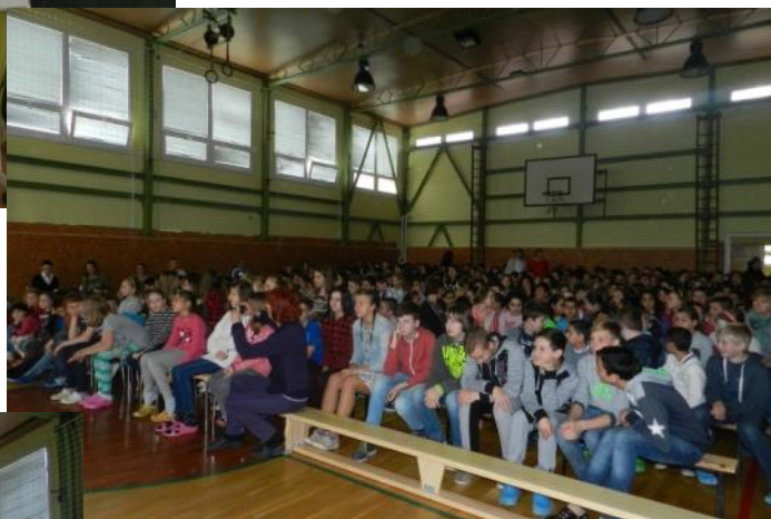
Zaplnená telocvičňa pred začiatkom slávnosti