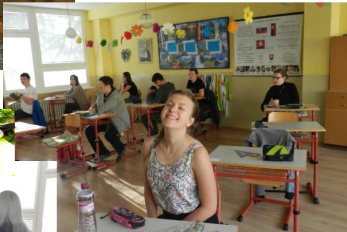
Nálada bola všelijaká, aj s úsmevom /trochu umelým/, aj celkom vážna, veď išlo o veľa