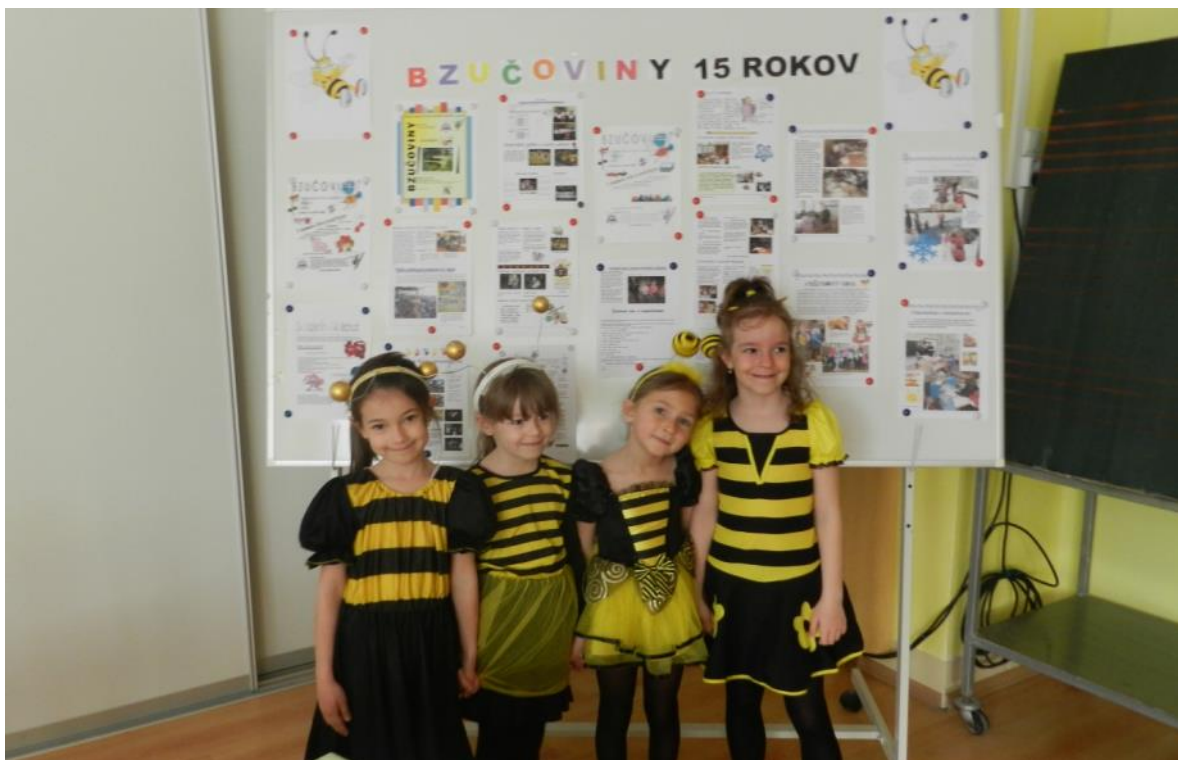
Dievčatká, symbolizujúce maskota BZUČA