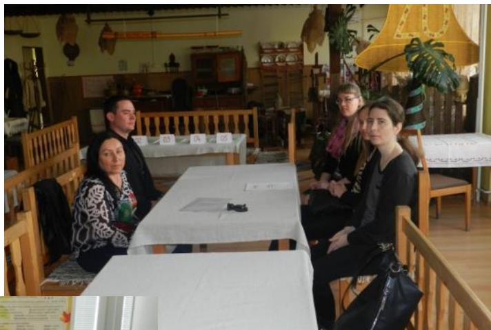
Externý dozor—pedagógovia zo ZŠ M.R.Štefánika