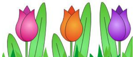
Netrpezlivé čakanie na vyhodnotenie