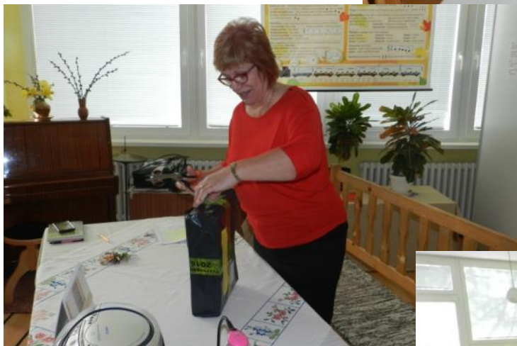
Slávnostné otváranie zapečatených obálok s úlohami