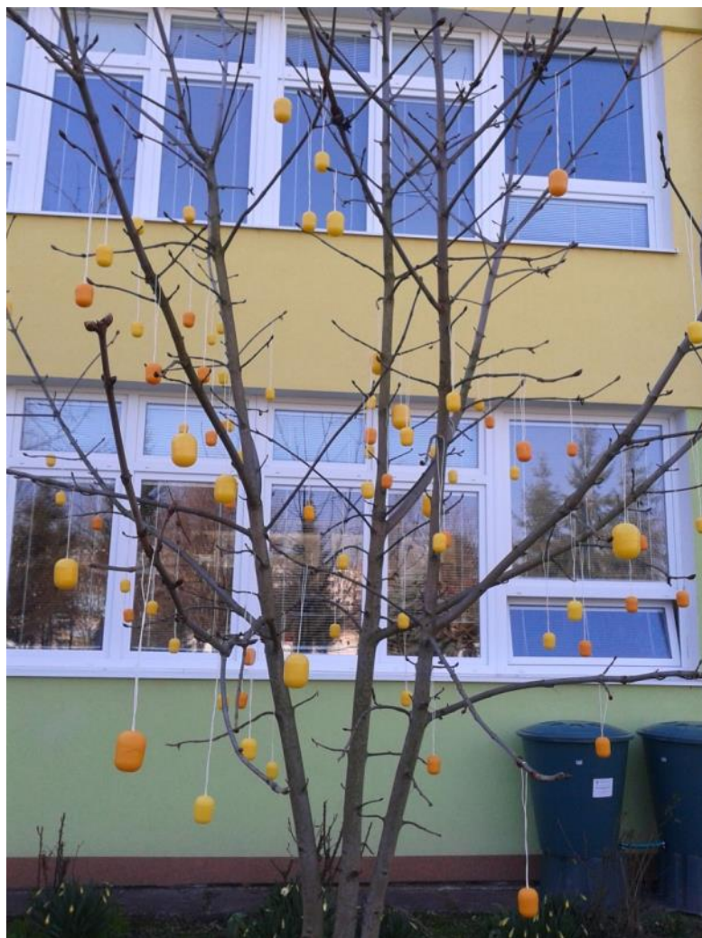
Svetová rarita—v škole nám vyrástol „vajcovník“