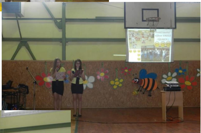
Oslavy sa páčili aj našim hosťom