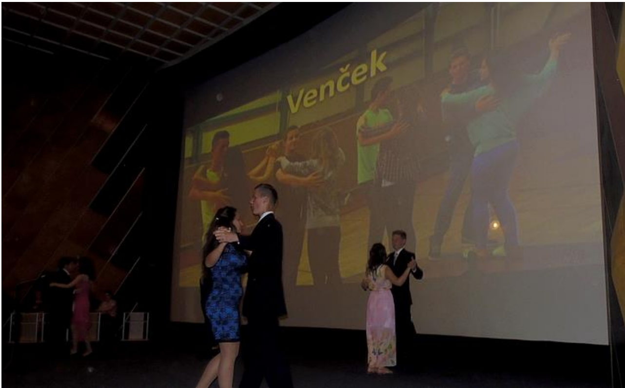
Rozlúčka s deviatkami—prezentáciám tried predchádzalo tanečné číslo—deviataci mali tesne po venčeku