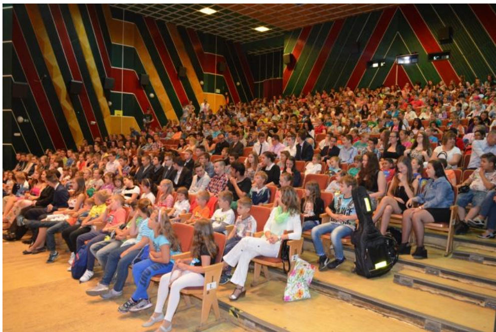
nabitá sála Kina Apollo v očakávaní