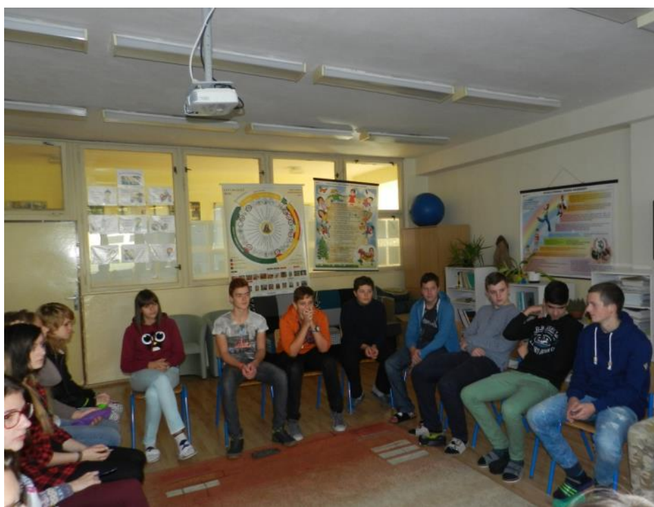
Text a foto L.Gomblaová