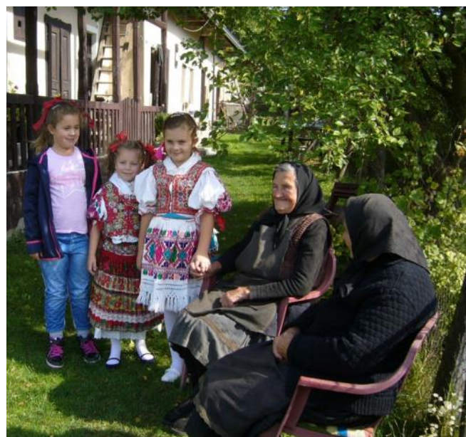
Sústredenie turistov pred Obecným úradom v Abelovej a posedenie s obyvateľmi tejto malebnej dedinky