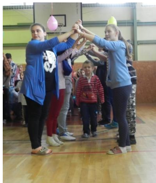
Symbolická brána do sveta školákov

Radosť, napätie, tréma, súťaživosť, zvedavosť, to všetko sa miešalo v hlavách našich najmenších. A zodpovední deviataci si svoju úlohu splnili znamenite.