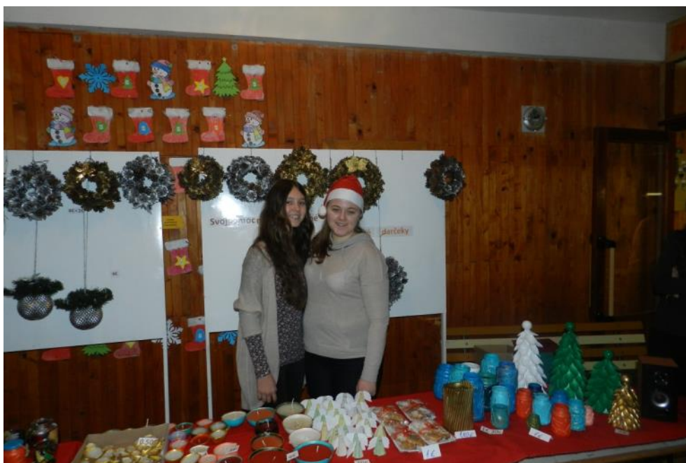
Text a foto L.Gombalová

Ostáva nám len rozlúčiť sa na Zimných radovánkach a potom sa už len tešiť na vianočné prázdniny.