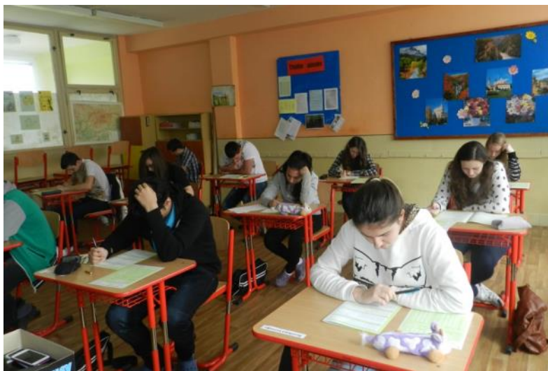
Vážne tváre, vážna chvíľa, vážne rozhodnutie