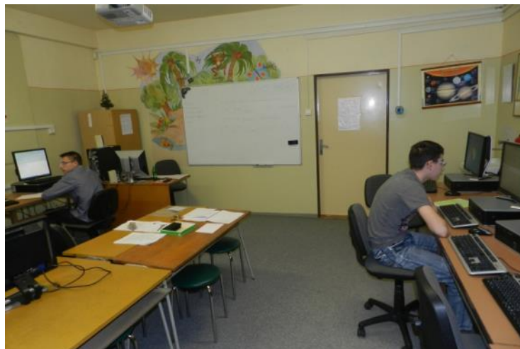
Prví a jediní dvaja odvážni, ktorí si zvolili počítačovú formu testu

V čase, keď vyjde toto číslo Bzučovín už žiaci budú mať oficiálne výsledky v rukách a všetku svoju aktivitu teraz upriamia na prijímacie skúšky. My im k tomu želáme veľa úspechov