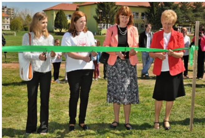
Slávnostné otváranie nových objektov, ktoré vyrástli v rámci projektu—nové jazierko a mini arborétum