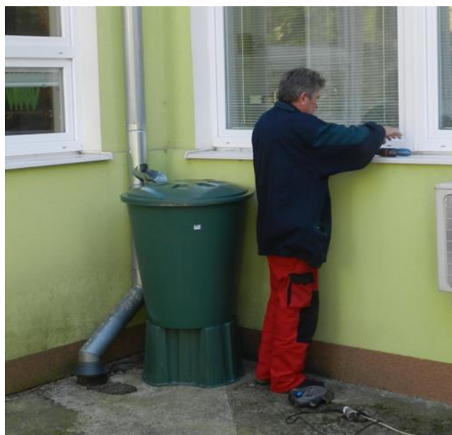
Inštalovanie zberných nádob na dažďovú vodu

Podpora zameraná na stratégiu, ktorá účinne, ekonomicky efektívne a environmentálne udržateľne napomôže k prevencii pred povodňami. Program bude zameraný na ochranu schopnosti retencie vody v pôde, lesoch a lúčach; obnovu lesných ekosystémov, zvýšená ochrana proti erózií a revitalizácia vodných tokov; zlepšenie vymedzenia záplavových území a ohroziteľných oblastí v prípade vzniku povodní; informovanosť a osвета verejnosti o prevencii a opatvaniach v prípade ohrozenia.