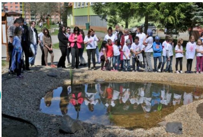
Najväčšou pýchou je druhé jazierko