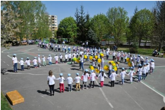
Po konferencii pokračoval program v škole. Na nádvorí sa predstavili všetci žiaci v živom obraze