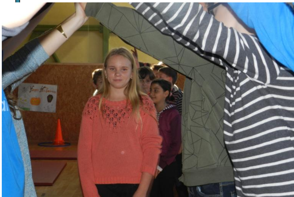
aj „velkí“ piataci museli prejsť pasovacou bránou

Pred niekoľkými rokmi sa školský parlament rozhodol pridať k pasovaniu prvákov aj druhý diel — pasovanie piatakov. Chceli tak novovytvoreným triedam na druhom stupni spríjemniť ich ťažké začiatky. A tak sa u nás z pasovačiek stal dvojdielny seriál. V réžii školského parlamentu a deviatkov je z roka na rok krajší a lepší. Posúďte sami.