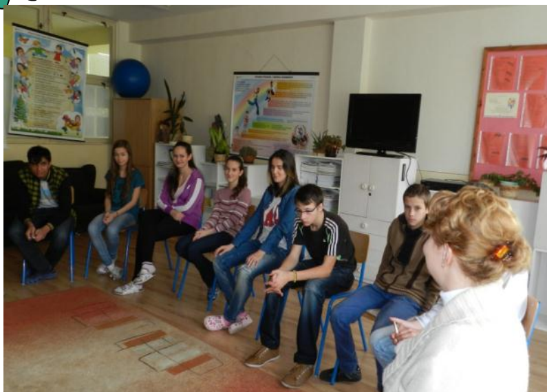
9.B v programe Čím chcem byť vo svojom živote

Naši deviataci to majú v tomto roku ozaj pestré. Chvíľu sa zabávajú /halloween a pasovačky/ a hneď na to sa musia venovať vážnym témam akými sú príprava na testovanie i prechod na stredné školy. Toto všetko si overovali na Kompare /voláme ho aj cvičný monitor/ ako aj na programe, ktorý pre nich pripravili pracovníci CPPPaP pod názvom Čím chcem byť vo svojom živote . Tak im teda držíme palce, aby im všetko vyšlo tak, ako si sami želajú