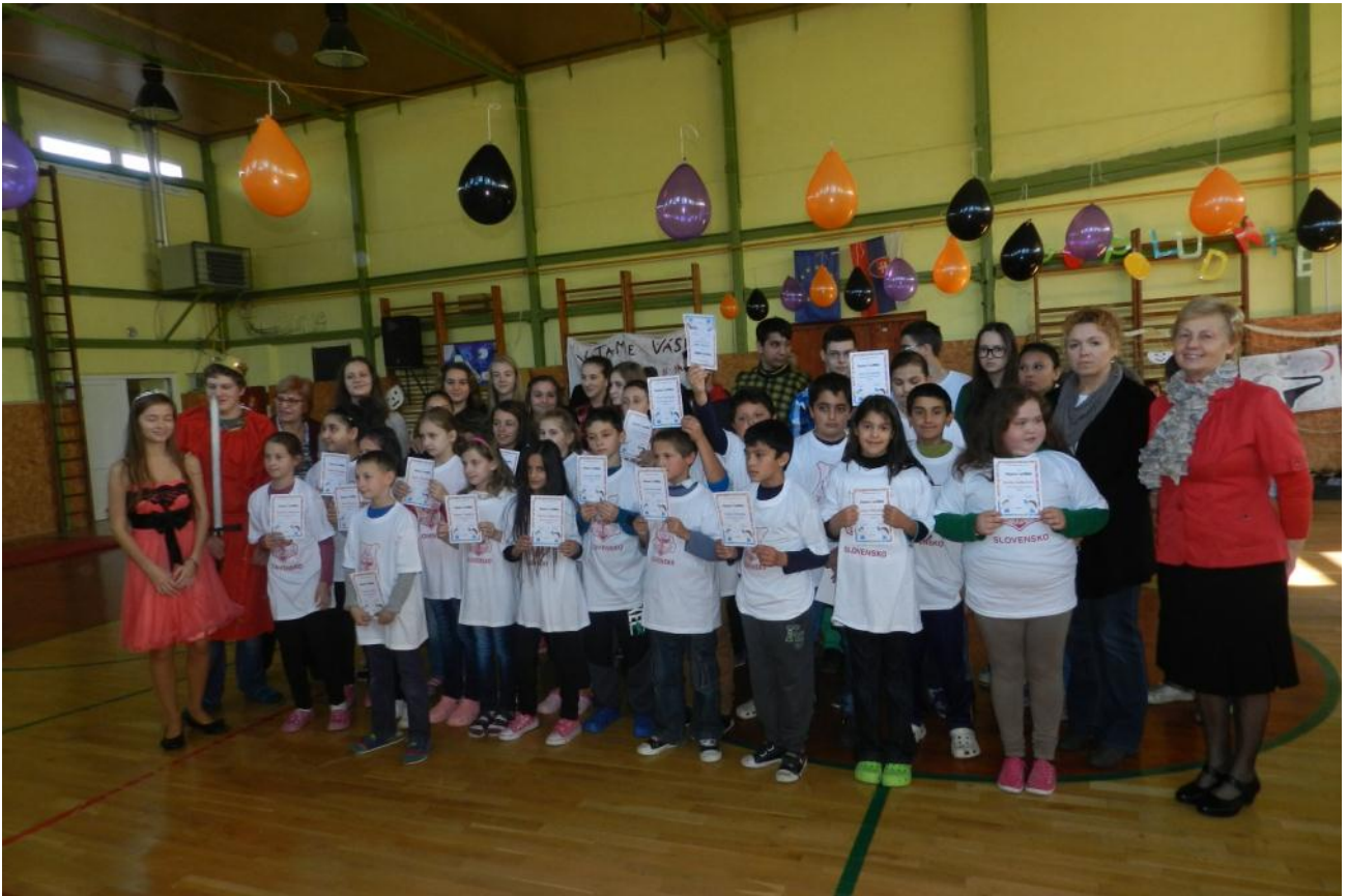
Nasledovali piataci z 5.B