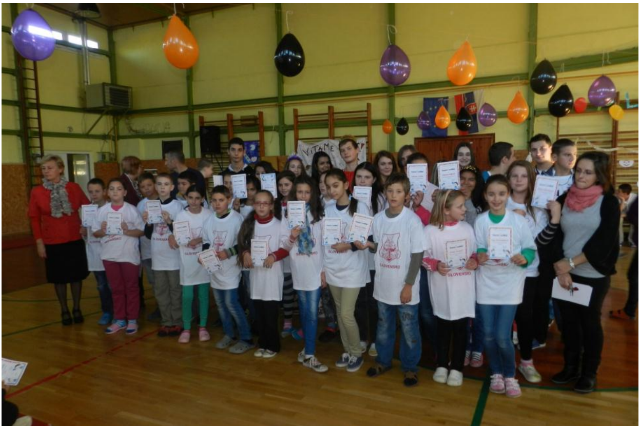
A na koniec nový kolektív 5.C